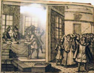
Hier lebet man auf Pland, und waer dich auß dem Land.