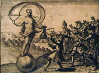
Des Glückes reiche Hand lan andern meinen Grund.

PAUL JACOB MARPERGERS Königl. Pol. und Chur. Sächf. Hof- und Commercien- Rath; wie auch Rector der Königl. Preuss. Societas der Wissenschaften